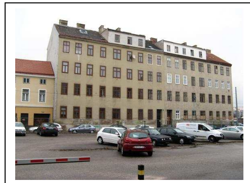
Fabriksgasse Februar 2009 Die beiden Häuser links sind bewohnt. Das Haus rechts hat der Projektbetreiber erworben