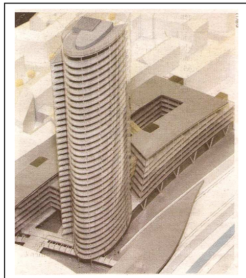
Komet- Planung ohne Berücksichtigung vorhandener Liegenschaften

bzgl. Möglicher Flächenwidmungsabsprache, Begünstigung eines Bauwerbers, Umgehung einer strategischen Umweltprüfung im Interesse des Bauwerbers, Desinformation diverser Gremien im Interesse des Bauwerbers. Selbstverständlich gilt für alle Beteiligten die Unschuldsvermutung.